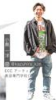
ECCアーティ 美容専門学校(中)

エリア等にお客様の雰囲気も変わるので 自分のスタイルも合わせるようにしています！