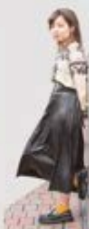
大庭ビューティーアー 美容専門学校(中)