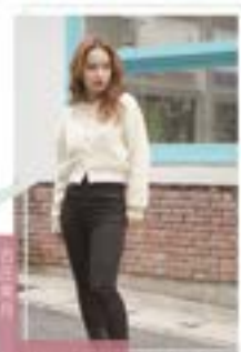
藤井ペルキュル 美容専門学校(中)