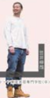
ニノノタカ 美容専門学校(中)