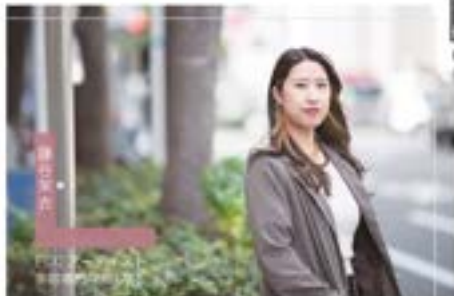
ECCアーティ 美容専門学校(中)