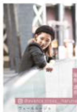
フォーラムージュ 美容専門学校(中)

エリア等にお客様の雰囲気も変わるので 自分のスタイルも合わせるようにしています！