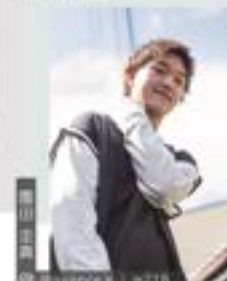
フォーラムージュ 美容専門学校(中)