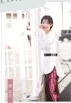
大庭ビューティーアー 美容専門学校(中)

華やかなファッションも大事！ けど、オシャレには手を抜かない のがAVANCE.スタッフです！