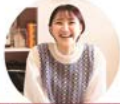
AVANCE CROSS への応募先