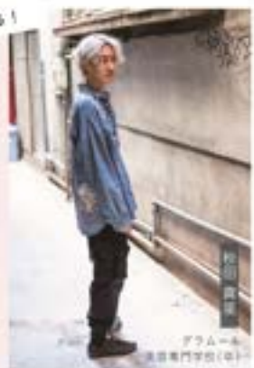
アラムーネ 美容専門学校(中)