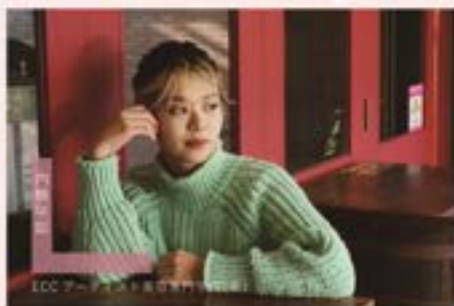
ECCアーティ 美容専門学校(中)